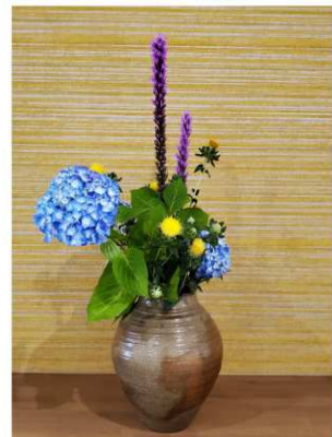
生け花ギャラリー