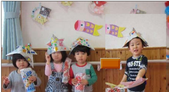
5月 ニいのほりとかぶとを作って、端午の節句のお祝いをしました。