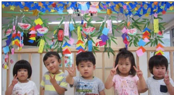
7月 セタまつりをしました 笹飾りを作って、お願い事をしました