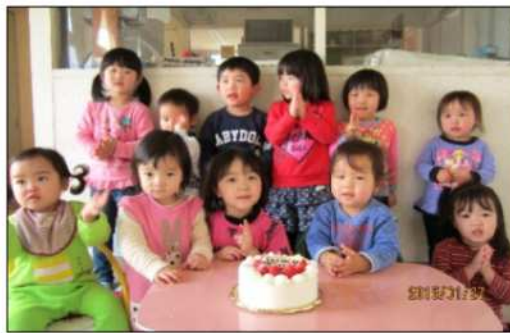
1月生まれのお誕生会