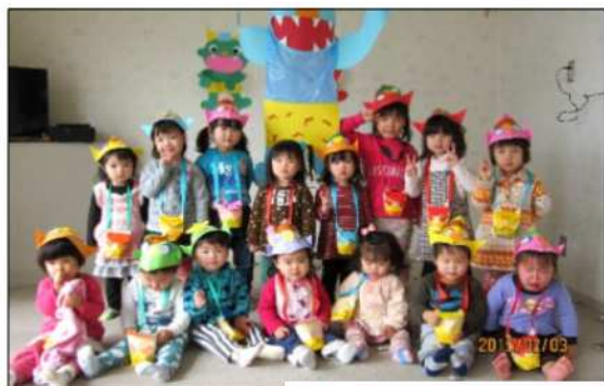
せつぶん・まめまぎ・おにたいじ