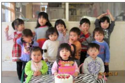
2月生まれのお誕生会