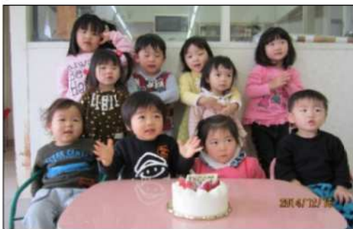
12月生まれのおたんじょうかい

(雛散らし寿司、酒粕汁、かつおのたたき、ももゼリー) ひし餅をイメージした押し寿司をひな祭りらしい色彩の3色ゼリーで桃の節句のお祝い御膳としました。