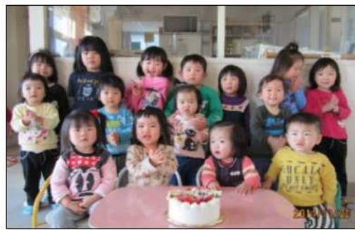
11月生まれのおたんじょうかい

前回号でお誕生会の表示が 入れ違いになっていました。 お詫びして訂正いたします。